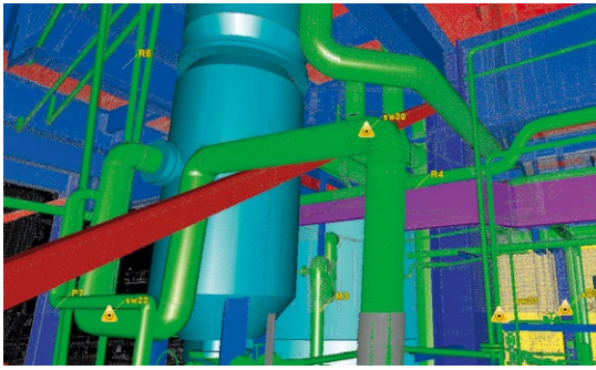
Die Funktion „Pipe Run“ modelliert nach Anklicken der geraden Rohrabschnitte automatisch einen zusammenhängenden Rohrverlauf mit allen Bögen in wenigen Sekunden.